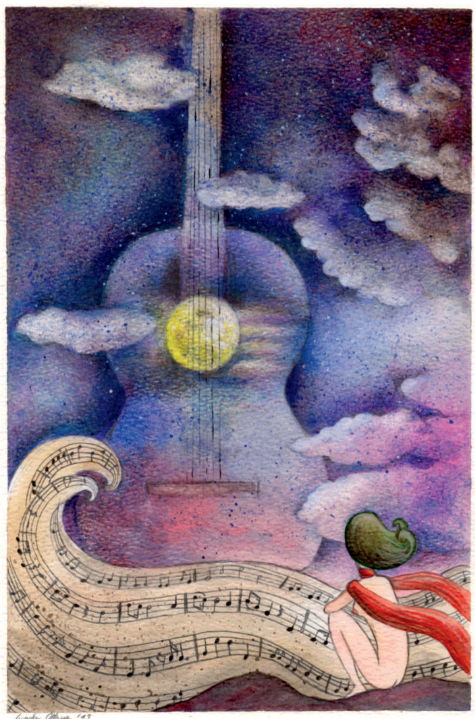
Illustrazione di Giada Ottone 7° Concorso Artistico per l'Ossola Guitar Festival

www.prolocovalledivedro.it www.artexe.org